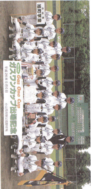
旭町学童 ガクスカップ出場記念 平成26年5月9日 小山市旭町2-25(旭町児童館)